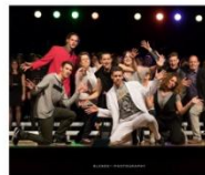
TRITONAL Musik www.musikschule-tritonal.de Musik-Mix Lassen Sie sich überraschen von einem abwechslungsreichen Konzert der Biberacher Musikschule Tritonal! An diesem Abend stehen nicht nur Nachwuchs-Stars auf der Bühne ...