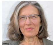
Andrea Reck freie Journalistin www.redaktionsbuero-andrea-reck.de Zum Höhlenloch der Schöpfung Äthiopien am Horn von Afrika sieht mit seinen Konflikten fast schon sinnbildlich für den Schwarzen Kontinent mit Überbevölkerung, Hungersnöten und ethnischen Konflikten. Seine landschaftlichen Schönheiten vom noch tätigen Vulkan Erta Ale in der Danakil Senke zu den Lobeliengärten an den Viertausendern der Semienberge sowie die Seenkette im Great Rift Valley jedoch sind einzigartig