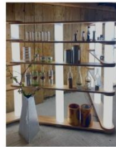
Johannes Reck Möbel www.duene-7.de Tische, Stühle und Lichtobjekte aus Edelstahl und Holz - mit Leidenschaft gefertigt, auch nach Ihren Wünschen