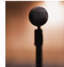
Musik zur Vernissage von TRITONAL www.musikschule-tritonal.de Bei uns kannst auch du Gitarren-, Bass-, Klavier-, Schlagzeug-, Saxophon-, und Gesangsunterricht nehmen