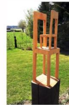
Wolff Zint Holzskulpturen www.zintdesign.de Holz, ausschließlich mit der Kettensäge bearbeitet - und doch überraschend fein