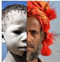
Andrea Reck freie Journalistin Fotografie und Fotoshow www.redaktionsbuero-andrea-reck.de Zum Höhlenloch der Schöpfung